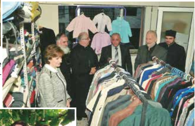
Les prêtres bénissent le nouveau centre social de Kfarchima.